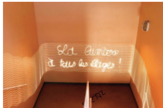
Exercice de lightpainting.

Productions écrites, soutenances orales.