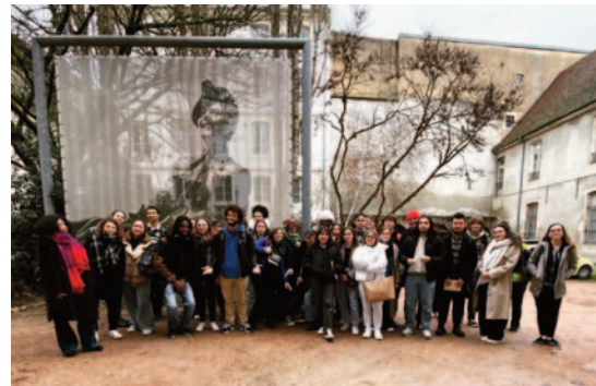
Visite commune du musée Nicéphore Niépce de Châlons-sur-Saône. Classes de DNMADE 1 ère et 2 ème année - 2023

Acquisition d'un socle commun de connaissances pour une culture plurielle. Consolidation d'une culture personnelle et critique, maîtrise de savoir-faire en vue de l'affirmation d'une personnalité artistique créative et singulière.