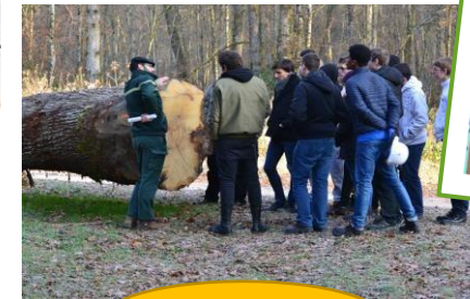
Sortie en forêt