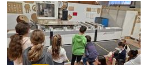
Découverte des machines